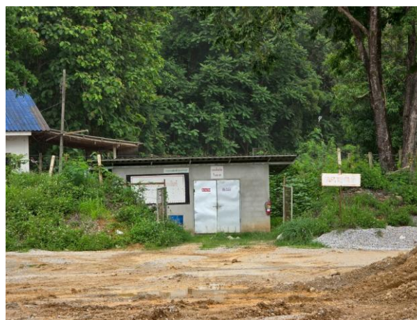
รูปที่ 2-2 (ต่อ) ป้ายเตือนเขตการใช้วัตถุระเบิด