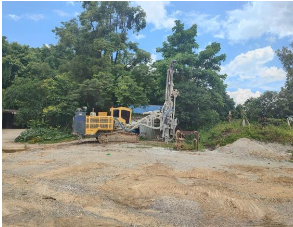
รูปที่ 2-16 เครื่องเจาะรูระเบิดของโครงการ