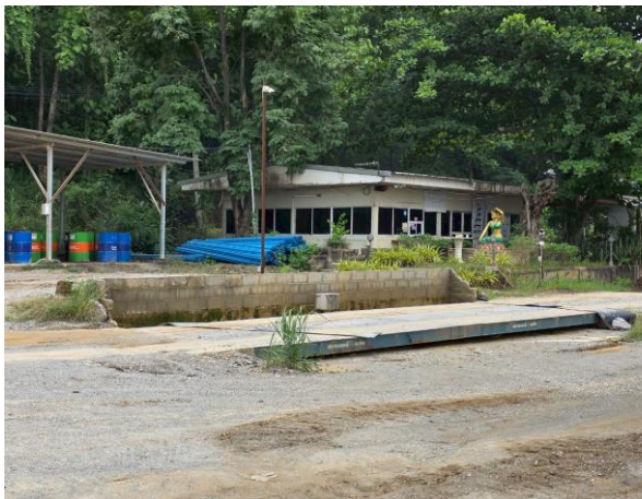
รูปที่ 2-6 ตาซังเพื่อป้องกันการขบรทุกน้ำหนักเกิน