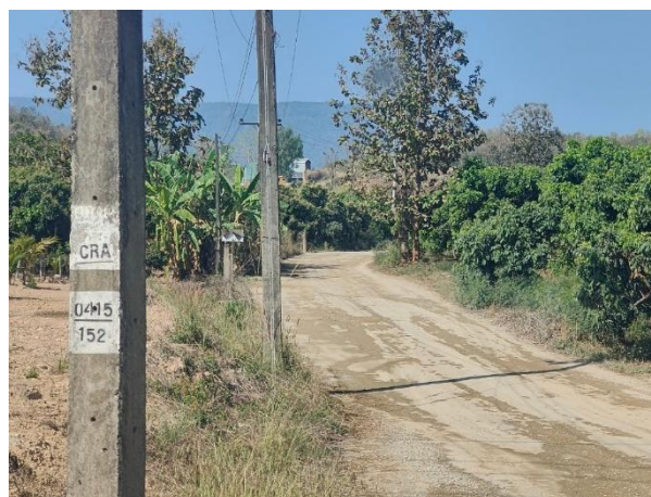
รูปที่ 2-4 สภาพถนนที่มีการดูแลจากทางโครงการ