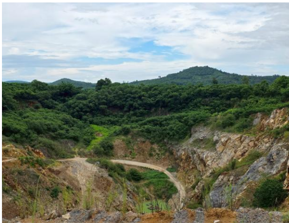
รูปที่ 2-1 หน้าเหมืองของโครงการที่มีการปรับแต่งให้เป็นไปตามที่มาตรการฯ กำหนด