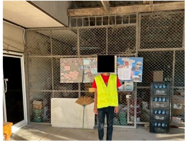
รูปที่ 2-12 อุปกรณ์ป้องกันอันตรายส่วนบุคคล