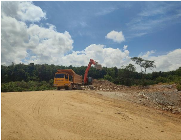
รูปที่ 2-11 การซ่อมแซมคันทำนบดินในช่วงหน้าแล้ง และเตรียมปลูกต้นไม้ในช่วงหน้าฝน