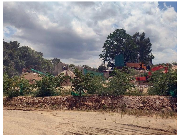
รูปที่ 2-23 (ต่อ) กิจกรรมการปลูกต้นไม้ เป็นแนวล้อมรอบโรงโม่