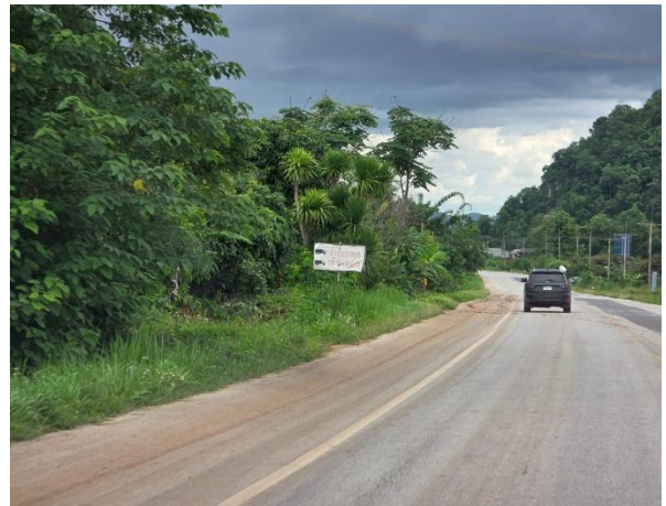
รูปที่ 2-19 ตัวอย่างป้ายระวางรถบรรทุกเข้า-ออก ของโครงการ