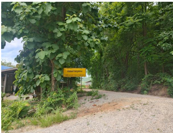
รูปที่ 2-14 แนวเวนพื้นที่การทำเหมืองเชิงเขาของวัด ถ้ำผาจรูญ