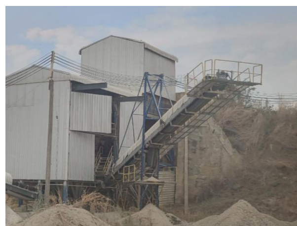
รูปที่ 2-7 (ต่อ) การสเปรย์น้ำที่ปลายสายพานลำเลียงหิน