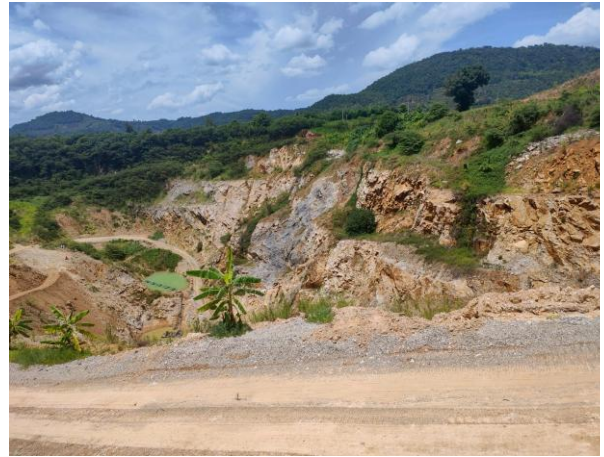
รูปที่ 2-17 ขุมเหมืองเก่าที่ดัดแปลงเป็นพื้นที่เก็บ กองเปลือกดิน