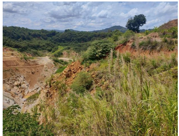
รูปที่ 2-13 (ต่อ) ตัวอย่างต้นไม้ที่ทำการปลูกใน กิจกรรมการฟื้นฟูพื้นที่การทำเหมืองด้านตะวันออก