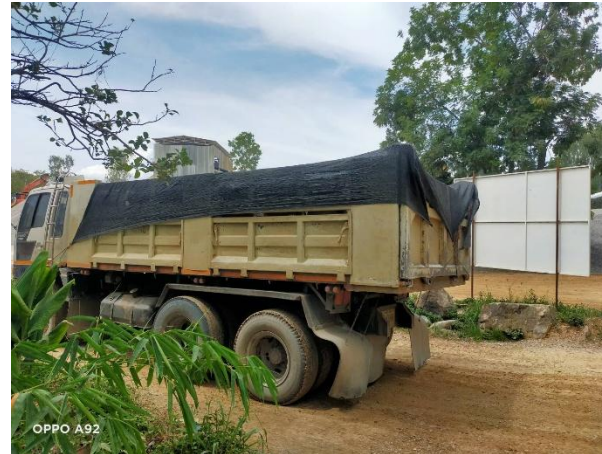
รูปที่ 2-5 (ต่อ) จุดปิดคลุมกระบะขบรทุกในโครงการ