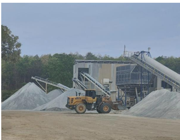
รูปที่ 2-7 โรงโม่หินที่ทำตามประกาศกรมอุตสาหกรรมพื้นฐานและการเหมืองแร่ของโครงการ