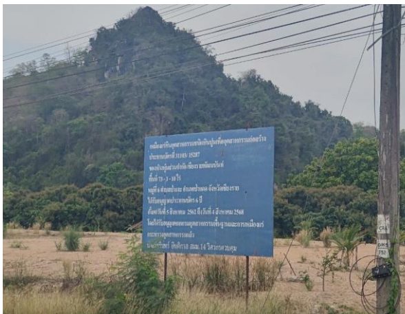
รูปที่ 2-24 ป้ายแสดงรายละเอียดโครงการ