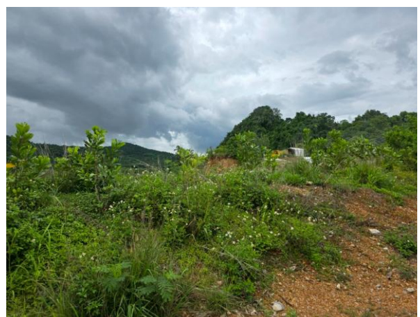
รูปที่ 2-10 (ต่อ) คั่นทำนบดินของโครงการ