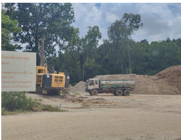
รูปที่ 2-3 การฉีดพรมพื้นที่และเส้นทาง