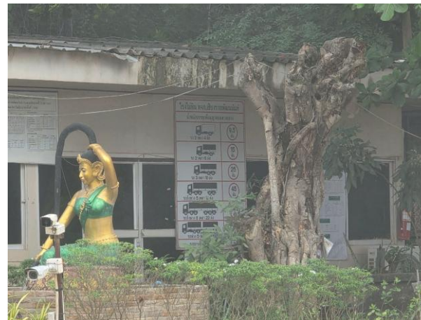
รูปที่ 2-6 (ต่อ) ตาซังเพื่อป้องกันการขบรทุกน้ำหนักเกิน