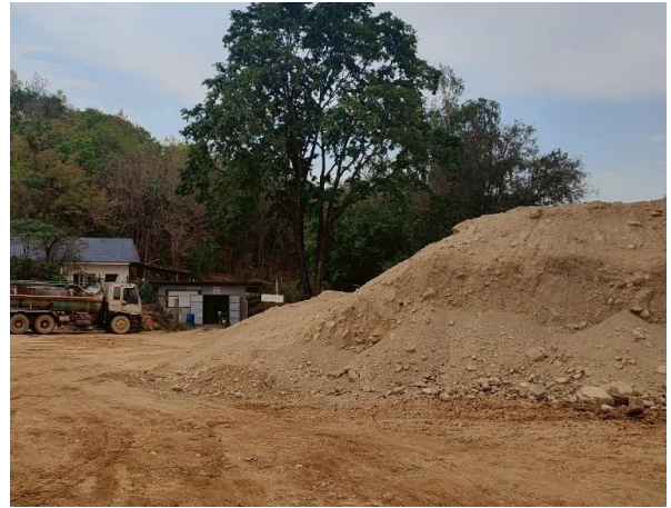
รูปที่ 2-8 จุดกองเปลือกดินตามแผนผังโครงการ