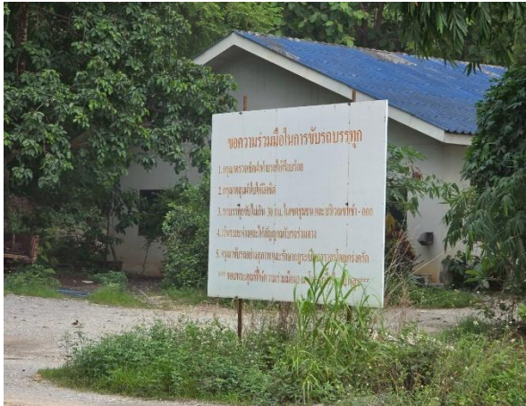
รูปที่ 2-5 ข้อกำหนดในการจราจรของโครงการ