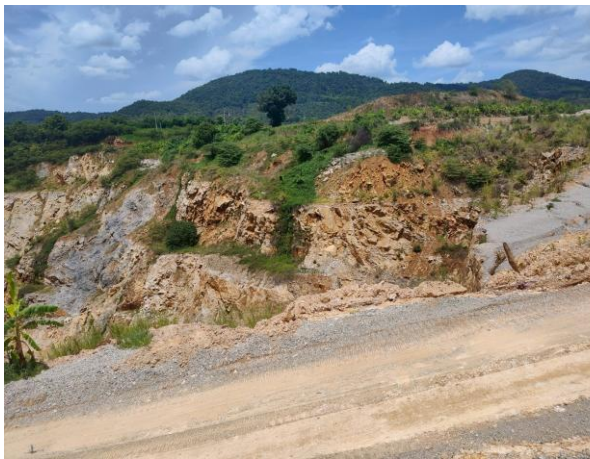
รูปที่ 2-13 ตัวอย่างต้นไม้ที่ทำการปลูกในกิจกรรม การฟื้นฟูพื้นที่การทำเหมือง