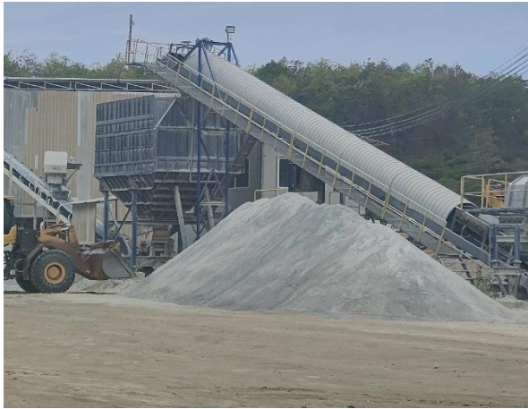
รูปที่ 2-7 (ต่อ) การปิดคลุมสายพานลำเลียง