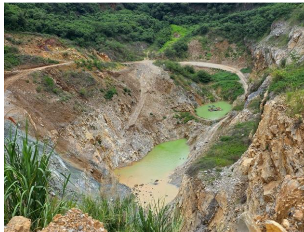
รูปที่ 2-1 (ต่อ) หน้าเหมืองของโครงการที่มีการปรับแต่งให้เป็นไปตามที่มาตรการฯ กำหนด