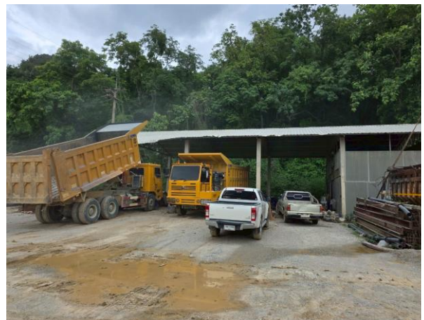
รูปที่ 2-21 โรงซ่อมบำรุงของโครงการ