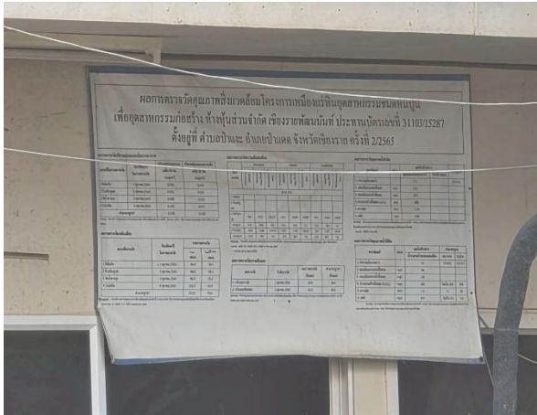
รูปที่ 2-22 ป้ายประชาสัมพันธ์ผลการตรวจวัด สิ่งแวดล้อมของโครงการ