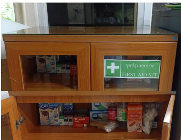
รูปที่ 2-20 ตู้ยาสำหรับปฐมพยาบาล