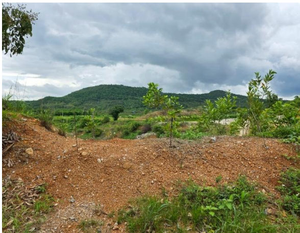
รูปที่ 2-23 (ต่อ) กิจกรรมการปลูกต้นไม้