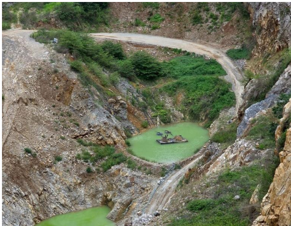
รูปที่ 2-18 บ่อรับน้ำบริเวณพื้นที่ต่ำสุด ของบ่อเหมือง