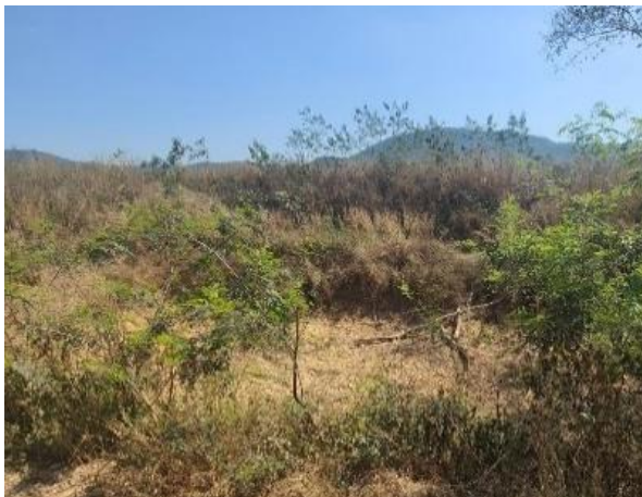
รูปที่ 2-9 ตัวอย่างบ่อดักตะกอนและคุ้ระบายน้ำที่มี การดูแลให้มีประสิทธิภาพเป็นอย่างดี