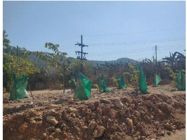
รูปที่ 2-23 กิจกรรมการปลูกต้นไม้