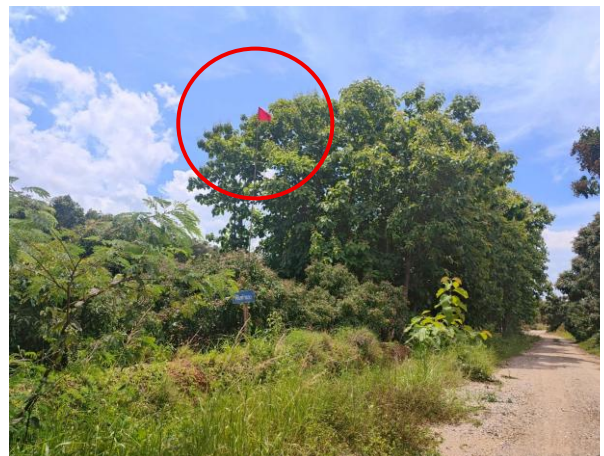
รูปที่ 2-15 ตัวอย่างแนวธงที่ใช้ในการแสดงเขตพื้นที่ ต่างๆในโครงการ