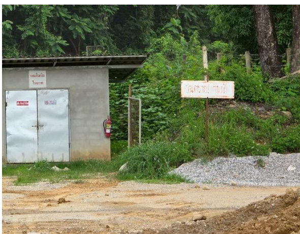
รูปที่ 2-2 ป้ายเตือนเขตการใช้วัตถุระเบิด