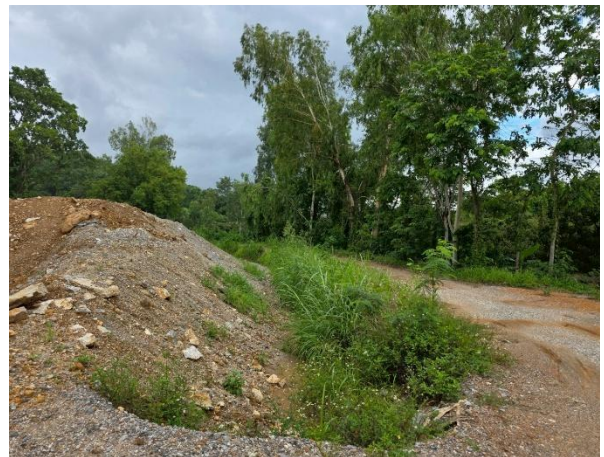
รูปที่ 2-9 (ต่อ) ตัวอย่างบ่อดักตะกอนและคุ้ระบาย น้ำที่มีการดูแลให้มีประสิทธิภาพเป็นอย่างดี